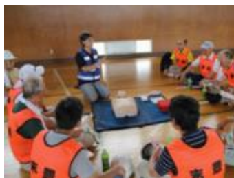
【心肺蘇生法（AED）の技術指導】