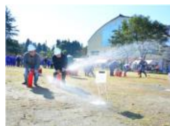
【水消火器を使用した消火訓練】