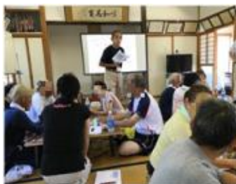
【防災に関する講話】